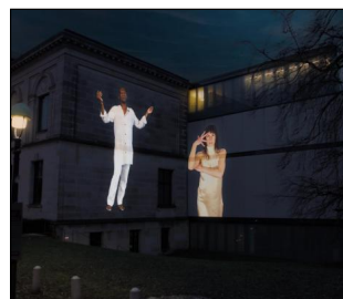
Digital Dialogues