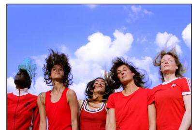
Kick & Rush!