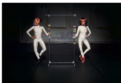
"Female Utilities #2 a fistfull of dollars" von Andrea Bleikamp; Lisa Hellmich & Sara Blasco Gutiérrez