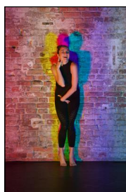
"Female Utilities #4 smartphone" von Andrea Bleikamp; Sara Blasco Gutiérrez