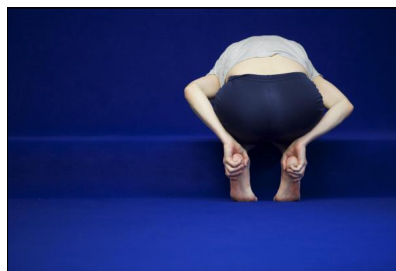
"Knotting" von Isabelle Schad; Francesca d'Ath