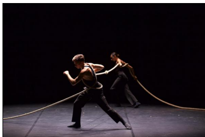
"LOve distaNT" von Vivian Assal Koohnavard; Marco Arena & Vivian Assal Koohnavard