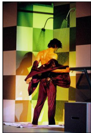
"La Stravaganza" von Jochen Ulrich

Jochen Ulrich habe ich von 1997 bis 2013 fotografisch begleitet. Im Dreiländereck um Aachen, Lüttich und Heerlen, in Reykjavik, Greifswald, Innsbruck und Linz. Es war immer besonders, mit Jochen Ulrich arbeiten zu dürfen. Die Fotos sind von verschiedenen Choreografien zwischen 1997 und 2013.