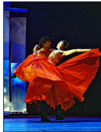
"Casanova" von Jochen Ulrich