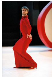
"3xLorca" von Jochen Ulrich