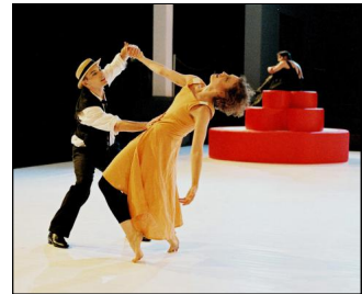
"3xLorca" von Jochen Ulrich