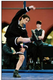
"Schwanensee-Rockballett" von Jochen Ulrich