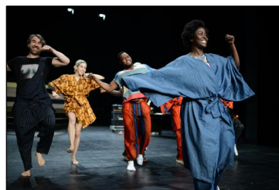
Gintersdorfer/Klaßßen_Kabuki Noir