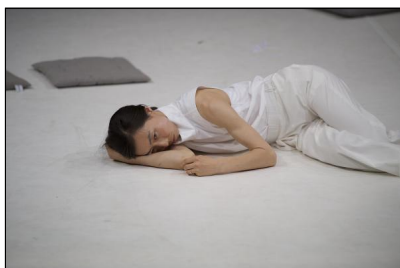
"to be (un)seen" von Hyoung-Min Kim