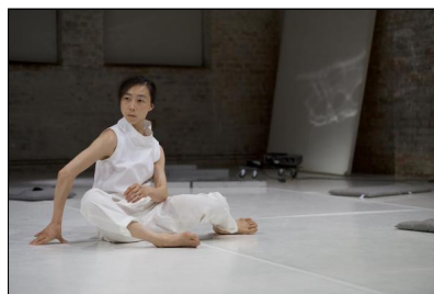
"to be (un)seen" von Hyoung-Min Kim