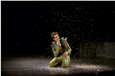
"Der Palast" von Constanza Macras und DorkyPark; Luc Guiol

Seit Jahren fotografiert Dieter Hartwig für tanznetz.de Ballett und zeitgenössischen Tanz hauptsächlich, aber nicht nur, in Berlin. Mit seinen oft täglichen Sendungen an Fotos ist er zum Chronisten der Tanzszene in der Hauptstadt geworden. Doch leider findet nur ein Bruchteil seiner Fotos Eingang in Tanzkritiken, da die Rezensionen für tanznetz.de bei Weitem nicht so zahlreich sind wie die Fotodokumentationen Hartwigs. Schon sehr lange geplant, haben wir nun eine Fotoblog-Serie gestartet, die in loser Reihenfolge fortgesetzt werden soll. Bei Hartwig, der in Bildern sieht und denkt, werden die Fotos die Hauptrolle spielen - unterstützt durch kleine Kommentare oder Gedanken, die er sich beim Fotografieren oder der Durchsicht der Ergebnisse macht.