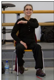
Lynn Seymour bei der Einstudierung von „Five Brahms waltzes in the manner of Isadora Duncan“ am Ballett am Rhein

Als Direktorin zeichnete sie von 1978 bis 1980 am Bayerischen Staatsballett verantwortlich. Nachdem sie 1981 ihre Ballettkarriere offiziell beendete, war sie weiter bei Gastauftritten in Balletten sowie in kleinen Rollen in Fernsehserien und Filmen zu sehen, bevor sie von 2006 bis 2007 das griechische Nationalballett leitete.