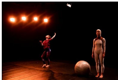
"Lost in Creation" von Anna Till und Martina Francone