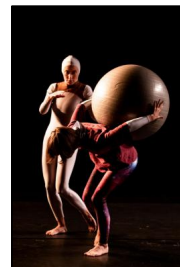
"Lost in Creation" von Anna Till und Martina Francone