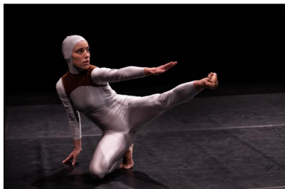
"Lost in Creation" von Anna Till und Martina Francone