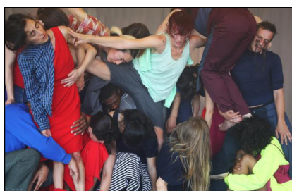
"Exodos" Ensemble Sasha Waltz & Guests

E - Exodos ist eine Produktion von Sasha Waltz & Guests in Koproduktion mit der Ruhrtriennale. Made in Radialsystem.