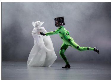
Ben J. Riepes "Environment" mit dem Ballett am Rhein