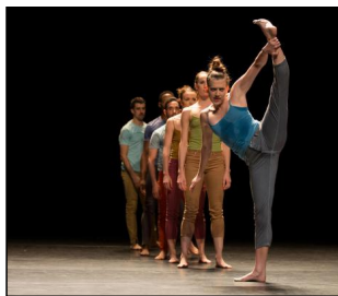
Ohad Naharins "Decadance" mit dem Ballett am Rhein