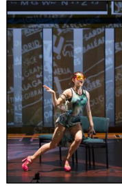
„Nouvelles Pièces Courtes“ der Kompanie DCA/Philippe Decouflé bei den Movimentos-Festwochen