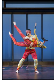
„Nouvelles Pièces Courtes“ der Kompanie DCA/Philippe Decouflé bei den Movimentos-Festwochen