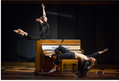
„Nouvelles Pièces Courtes“ der Kompanie DCA/Philippe Decouflé bei den Movimentos-Festwochen