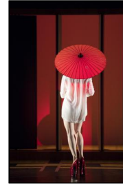
„Nouvelles Pièces Courtes“ der Kompanie DCA/Philippe Decouflé bei den Movimentos-Festwochen