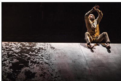
Akram Khan mit „Xenos“ im Festspielhaus Hellerau