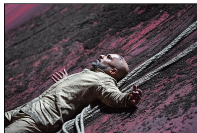
Akram Khan mit „Xenos“ im Festspielhaus Hellerau