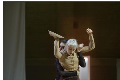
„momentum“ von Toula Limnaios in der Halle TanzBühne Berlin