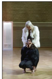
„momentum“ von Toula Limnaios in der Halle TanzBühne Berlin