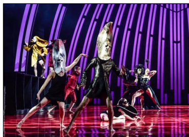
Mei Hong Lins "Romeo und Julia" in Linz