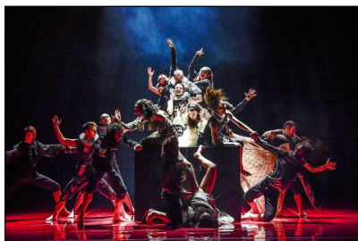
Mei Hong Lins "Romeo und Julia" in Linz

Einen Prolog stellt Lin, außer den "Symbolen", ihrer emotionalen Deutung voran, um die Vorgeschichte von Shakespeares Tragödie in Erinnerung zu rufen. Das grausame Fazit des gemeinsamen Liebestodes: ein Jahr nach dem Ableben des jungen Paares trennt unversöhnlicher Hass noch immer die beiden Veroneser Familien am Sarkophag der Kinder. Als Retrospektive entrollt sich das damalige Geschehen. Aber kaum angedeutet werden die bekannten Shakespeare'schen Szenen und Schauplätze. Vor allem kreisen die brillanten, technisch unglaublich vielgestaltigen Ensembles und Pas de deux um alle nur denkbaren emotionalen Varianten von Zweisamkeit. So echt kommt das vielfache, tragische Nacheinander innerhalb nur weniger Tage von "himmelhoch jauchzend" bis "zu Tode betrübt" rüber, dass die von der Choreografin angedachte Allgemeingültigkeit auch das gefühlte Mitleiden vervielfacht.