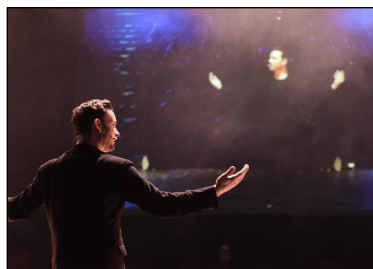
"The Gift" von Itzik Galili für Eric Gauthier