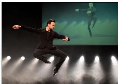
"The Gift" von Itzik Galili für Eric Gauthier