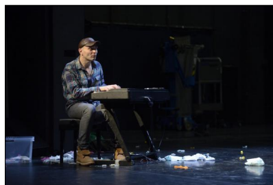
"Out" von Ivo Dimchev für das DANCE ON Ensemble; Ivo Dimchev