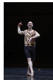
"Out" von Ivo Dimchev für das DANCE ON Ensemble; Christopher Roman