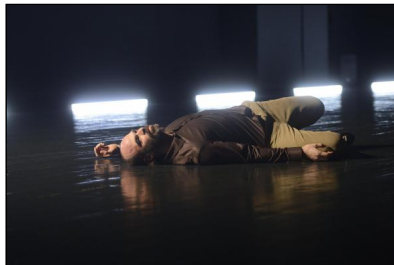
"mind eraser II" von Johannes Wieland für das DANCE ON Ensemble; Evangelos Poulinas