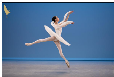
Hanna Park