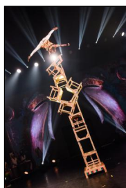
"Afrika! Afrika! - 2018" von Georges Momboye