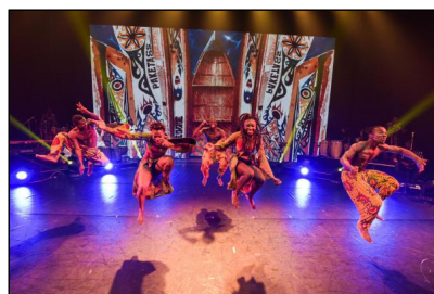
"Afrika! Afrika! - 2018" von Georges Momboye