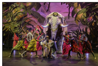
"Afrika! Afrika! - 2018" von Georges Momboye