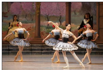
Viktoria Tereshkina als „Paquita“ vom Mariinsky Ballett in Baden-Baden