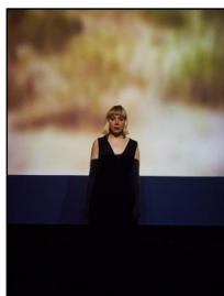
„Manon Lescaut“ von Lulu Obermayer