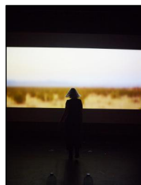
„Manon Lescaut“ von Lulu Obermayer