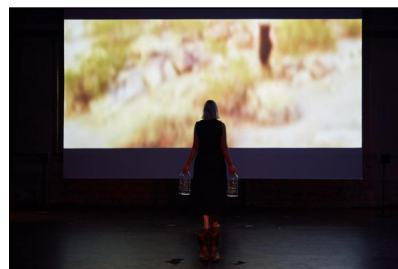
„Manon Lescaut“ von Lulu Obermayer