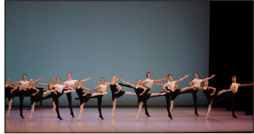
Heinz Bosl Matinée in München: "Klassenkonzert"