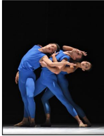
Heinz Bosl Matinée in München: "Stimmenstrahl" von Maged Mohamed