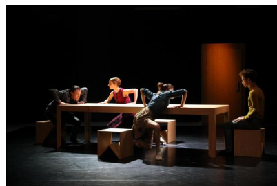
„Home, Sweet Home“ von Mauro de Candia