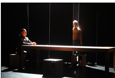
„Home, Sweet Home“ von Mauro de Candia

Die Klangcollage setzt sich aus Kammermusik zeitgenössischer Komponisten zusammen, originell vor allem in den klopfenden Klängen und Rhythmen aus „Journey“ und „Windows“ der Finin Kaija Saariaho. Wogegen (nicht identifizierte) Ausschnitte aus einem Stimmengewirr zu Beginn und gegen Ende der 90-minütigen Performance eher den Wunsch nach der Lesung von Kafka-Textstellen weckt. Allerdings: zu nah wollte de Candia Kafkas anrührenden und aufwühlend intimen Reflexionen wohl gar nicht kommen. Womöglich ließ er sich von dessen verallgemeinernder Aussage inspirieren, sich ein ganz normales Leben zu wünschen – „Heirat, Familiengründung und alle Kinder, welche kommen, hinnehmen“ gelinge „tatsächlich nicht vielen,“ und so suche er selbst nur ein „Plätzchen auf der Erde, .... wo manchmal die Sonne hin scheint und man sich wärmen kann“.