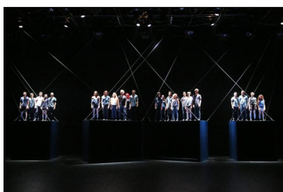
„Auguri“ von Olivier Dubois