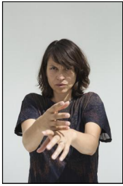
„Hérétiques“ von Ayelen Parolin

Diesem bereichernden und abgerundeten Abend nach, war bestimmt auch der darauf folgende Festivaltag ein aufregendes Erlebnis, an dem vielleicht sogar der Begriff des Radikalen, der wohl erst in der Gesamtbetrachtung des Programms zu Tage tritt, sichtbar wurde.