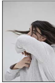
„Gone in a heart beat“ von Louise Vanneste © Laetitia Bica