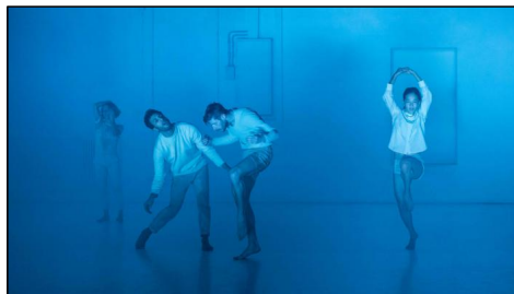
„Boids“ von Moritz Ostruschnjak