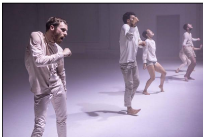
„Boids“ von Moritz Ostruschnjak © Jubal Battisti