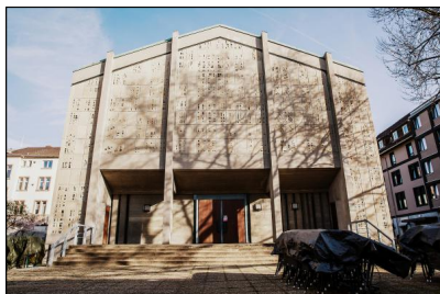
Außenansicht EinTanzHaus