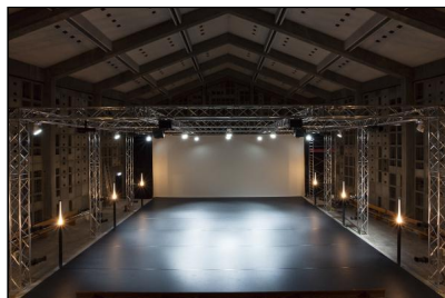
Verbindung von denkmalgeschützter Architektur und modernem Bühnenbetrieb. Denkmalgeschützte Elemente wie die feste Seitenbeleuchtung wurden in den Umbau integriert.