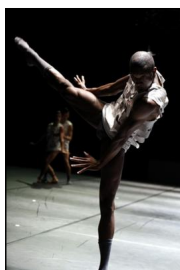
"Three Stages: Model - In Medias Res - El Dorado" von Richard Siegal