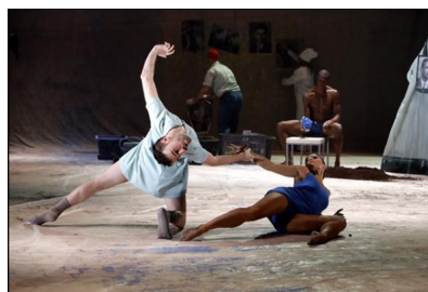
"Three Stages: Model - In Medias Res - El Dorado" von Richard Siegal