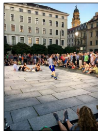
„MOLAR“ von Quim Bigas