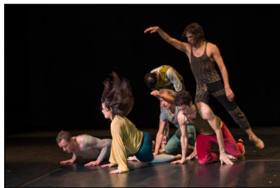
„inaudible“ von Thomas Hauert

Dann kommen Gershwin und die große, erleuchtete Bühne, auf der die TänzerInnen aufgereiht antreten. Nach einem fixen Schema wird ihnen in unterschiedlicher Konstellation Raum für Improvisation gegeben. Nach dem Prinzip des sogenannten Mickey-Mousing werden tänzerische Umsetzungen von melodischen Verläufen, Rhythmen oder spezifischen Klangqualitäten gesucht. Dabei ist die Musik von sich aus schon so physisch, dass sie Gesten und Bewegungen vorzugeben scheint und an vielen Stellen eine humorvolle Komponente beinhaltet. Welche Lösungen werden gefunden, um sie in die Sprache des Körpers zu übersetzen? Nach etwa der Hälfte des Stücks schleichen sich Angleichungen im Stil ein, Synchronisation von Akzenten, rhythmische Übereinstimmungen, Ähnlichkeiten in der Bewegungsqualität – als würden sich die Körper gegenseitig infizieren. Zwischen Chaos und Struktur bildet sich die spezifische Ästhetik einer Gruppe heraus.