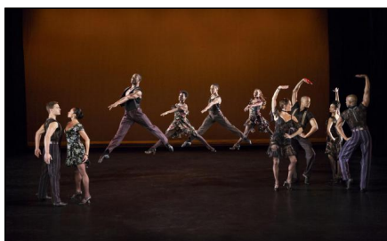
„Piazzolla Caldera“ von Paul Taylor

Absolut bestechend ist der Repertoirebestandteil des Programms: das 1997 von Paul Taylor geschaffene Stück „Piazzolla Caldera“. Sinnlich, ekstatisch und unter absoluter Hochspannung wird hier der Geist des Tangos ausgeleuchtet: ein Tanz, in dem alles geht – außer Einsamkeit. Einen überzeugenden Fingerabdruck hinterließ der amtierende künstlerische Direktor der Kompanie, Robert Battle, mit dem kurzen Solo „Takademe“ (1999). Hier hat indischer Kathak-Tanz Pate gestanden, den der Choreograf klug und witzig dekonstruiert, zum verblüffend jazzigen rhythmischen Silbengesang von Sheila Chandra.