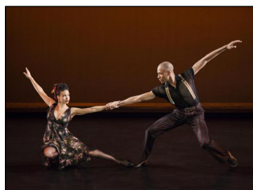
„Piazzolla Caldera“ von Paul Taylor