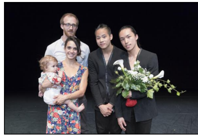
Gewinner des Tanzpreises