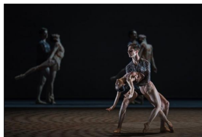
„disTANZ“ von Felipe Portugal