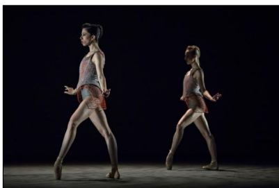
„disTANZ“ von Felipe Portugal © Gregory Batardon