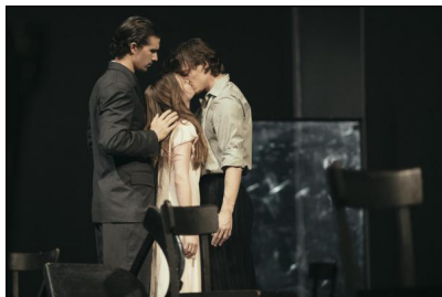
„Café Müller“ von Pina Bausch

Am Ende bleibt der Anfang in stärkster Erinnerung, „Café Müller“ von Pina Bausch mit den Tänzerinnen und Tänzern des Ballet Vlaanderen und die schwer zu beantwortende Frage, ob dies der Reihenfolge geschuldet war oder doch daran lag, dass sich nur schwer andere Stücke finden lassen, die einer solchen Korrespondenz standhalten können.