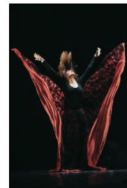
„Chronicle“ von Martha Graham