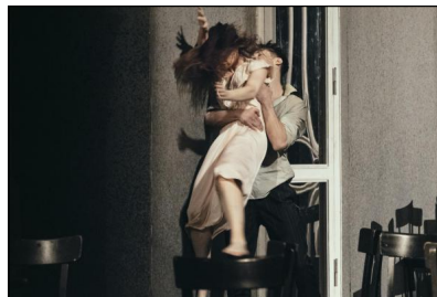
„Café Müller“ von Pina Bausch