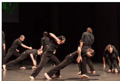
"Speedless" von Gregor Zöllig