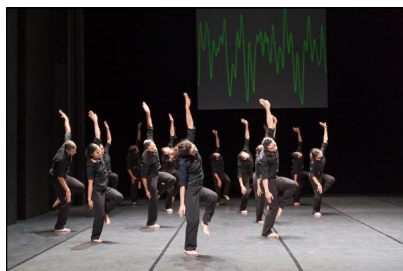
"Speedless" von Gregor Zöllig

Bessere Bedingungen für die Trainings- und Probenarbeit. Mein großer Wunsch ist es, in Braunschweig ein neues Probenzentrum für den Tanz aufzubauen. Zur nächsten Spielzeit wechselt am Staatstheater die Intendanz. Ich arbeite daran.