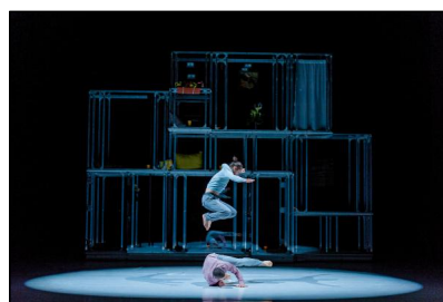
„iHome“ - das neue Tanzstück am Gerhart-Hauptmann-Theater Görlitz-Zittau