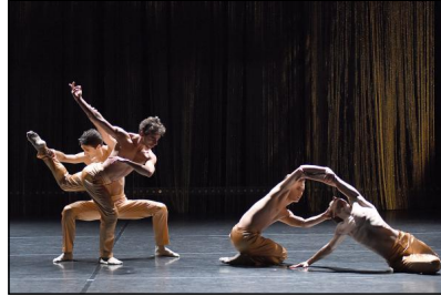
"Streams" von Andonis Foniadakis; Gauthier Dance // Dance Company Theaterhaus Stuttgart