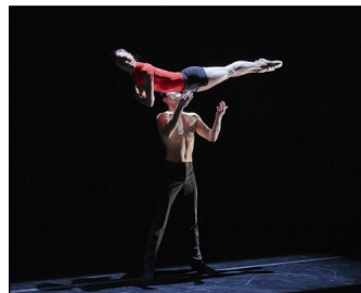
Der vierteilige Ballettabend „[R]Evolution“ am Theater Augsburg