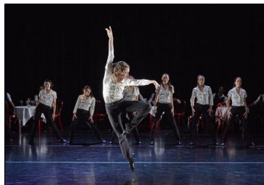
Der vierteilige Ballettabend „[R]Evolution“ am Theater Augsburg