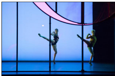
„Tree of Codes“ von Wayne McGregor