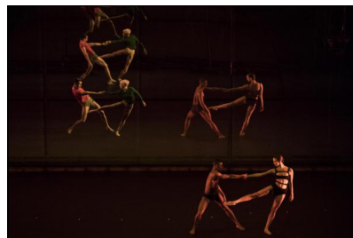
„Tree of Codes“ von Wayne McGregor