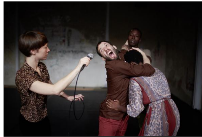
"Fragiland" von Jacobs | Koné | Manjate | Till