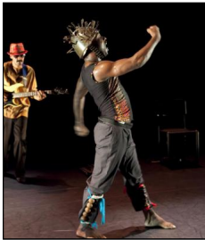
"Time and Spaces: The Marrabenta Solos" von Panaibra Gabriel Canda