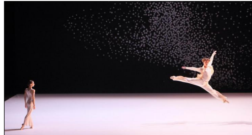
Ballettfestwoche 2014: Aszure Barton's "Konzert für Violine und Orchester"