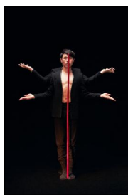
„Innermost“ von Po-Cheng Tsai