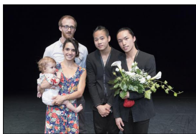
Gewinner des Tanzpreises