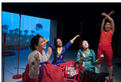
„Minorities“ von Yang Zhen

Zum Ende gibt es noch einmal befreites Haareschleudern zu einer chinesischen Rammstein-Version, die Energie der jungen Frauen ist enorm, zudem wirkt alles authentisch. Als Abschluss überrascht der Auftritt einer professionellen Sopranistin in Abendgarderobe, die das Lied von der Liebe zu China singt. Ein versöhnlicher Ausklang, dem die vier Tänzerinnen sich anschließen, den ein westliches Theaterpublikum allerdings nicht bräuchte. Der Ruf nach Freiheit und die Hoffnung auf ein selbstbestimmtes Leben sind überdeutlich.