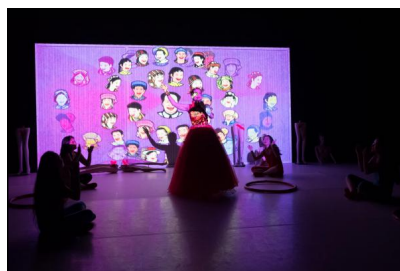
„Minorities“ von Yang Zhen